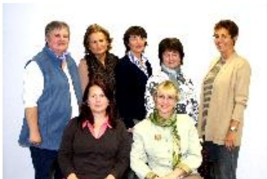
von links nach rechts

Auskunft und Beratung erhalten Sie von allen Mitarbeiterinnen des vhs-Teams in der Geschäftsstelle in der Bahnhofstraße 2. Persönlich sind wir täglich von 9 – 12 Uhr, telefonisch von 9 – 15 Uhr für Sie da. Gerne vereinbaren wir auch individuelle Termine mit Ihnen.